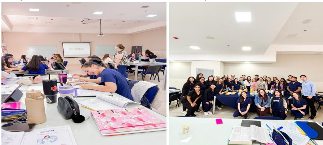
Imagen 11. Estudiantes de Nutrición en el workshop de análisis de casos clínicos

La Universidad del Pacífico realizó un Workshop de Casos Clínicos dirigido a estudiantes del tercer año de Nutrición, orientado a fortalecer el razonamiento clínico y la aplicación práctica de conocimientos. La actividad incluyó el análisis de casos reales y la elaboración de planes alimentarios, promoviendo el trabajo en equipo y habilidades profesionales clave (ver imagen 11).