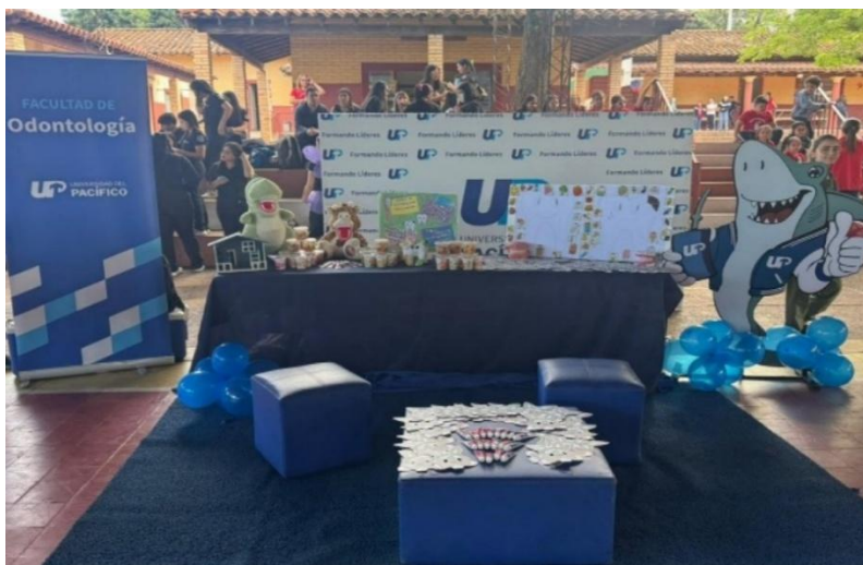
Imagen 8. Estudiantes de Odontología de la UP participan en Expo Odontológica comunitaria

Los estudiantes de Odontología de la Universidad del Pacífico participaron en la Expo Odontológica "Sonrisas Brillantes, Futuros Brillantes", organizada por el Círculo de Odontólogos del Paraguay en la Escuela Básica Redentorista Nº 1041 "Santísimo Redentor". Durante la actividad, los futuros profesionales atendieron un stand enfocado en la prevención de caries y la promoción de hábitos alimentarios saludables, fortaleciendo su compromiso social como parte de su formación académica (ver imagen 8).