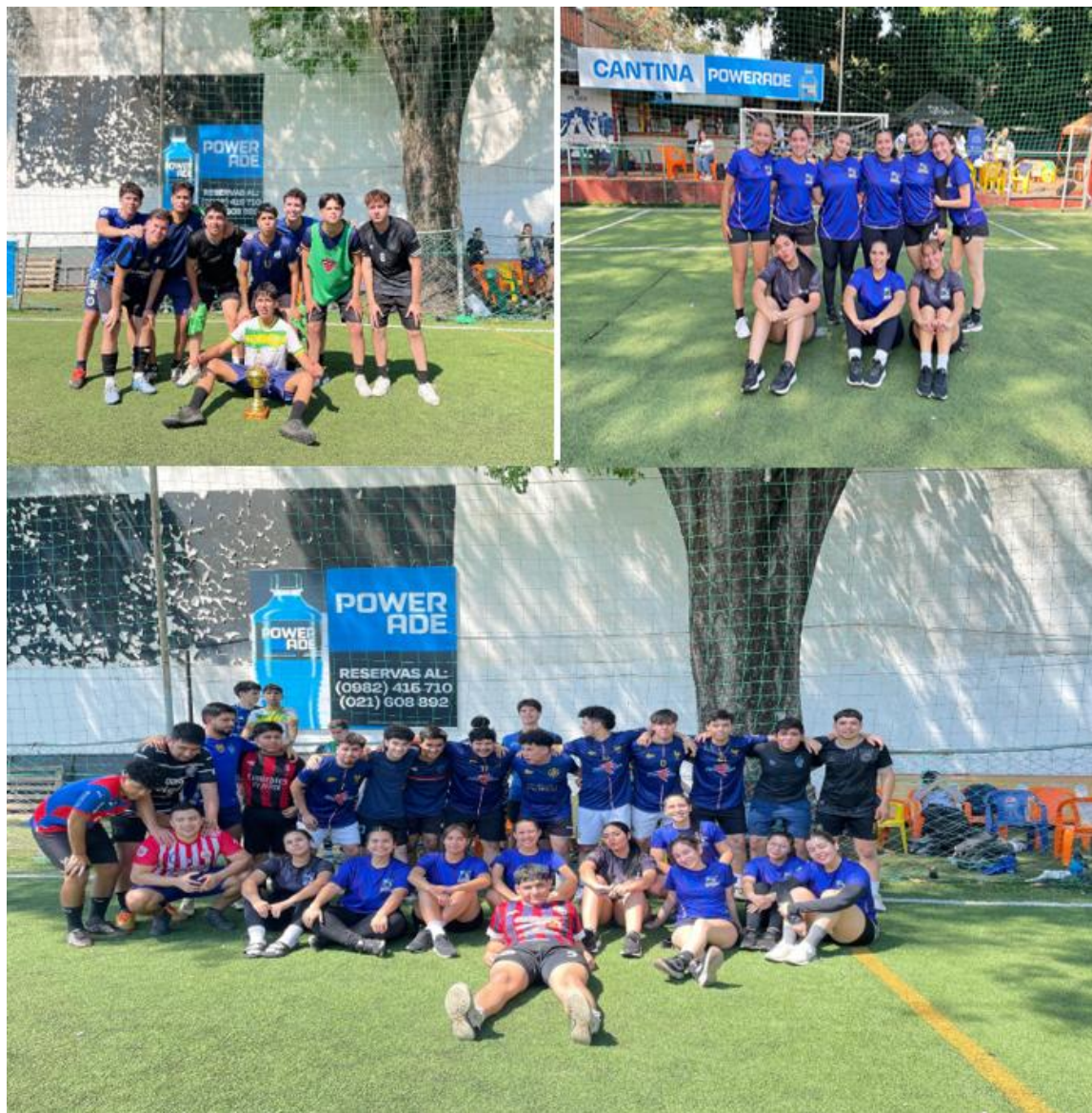
Imagen 21. Equipos y participantes durante el Torneo Estudiantil UP 2025 (Relámpago)