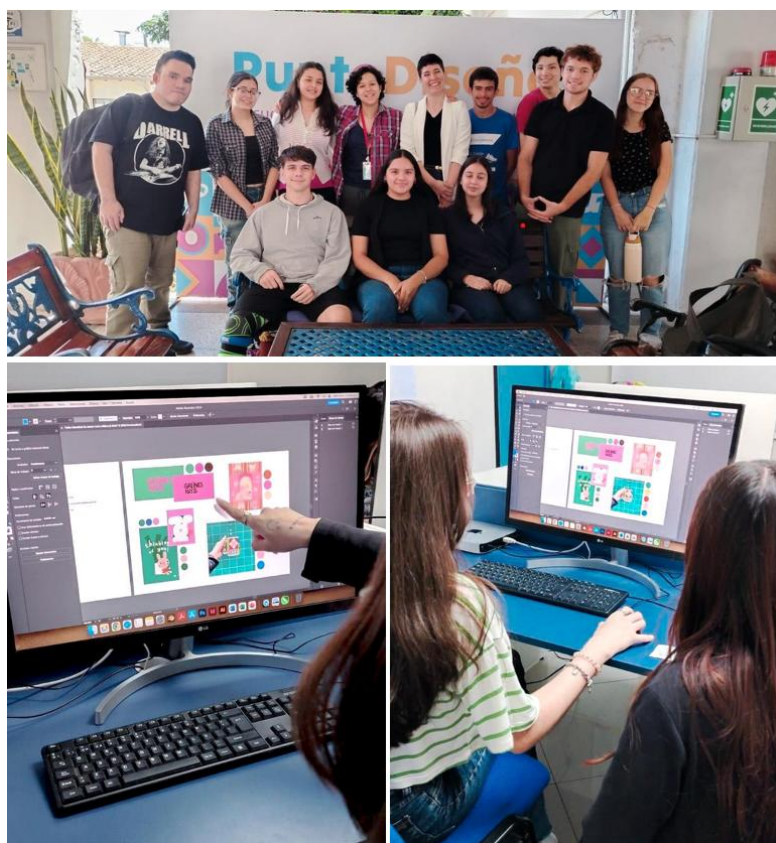
Imagen 16. Taller de diseño de identidad con estudiantes de la Universidad del Pacífico