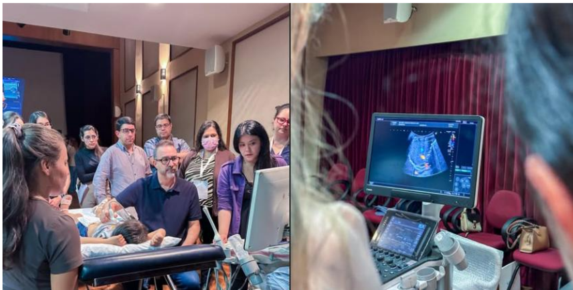
Imagen 4. Curso internacional sobre diagnóstico por imágenes en pediatría con auspicio de la UP