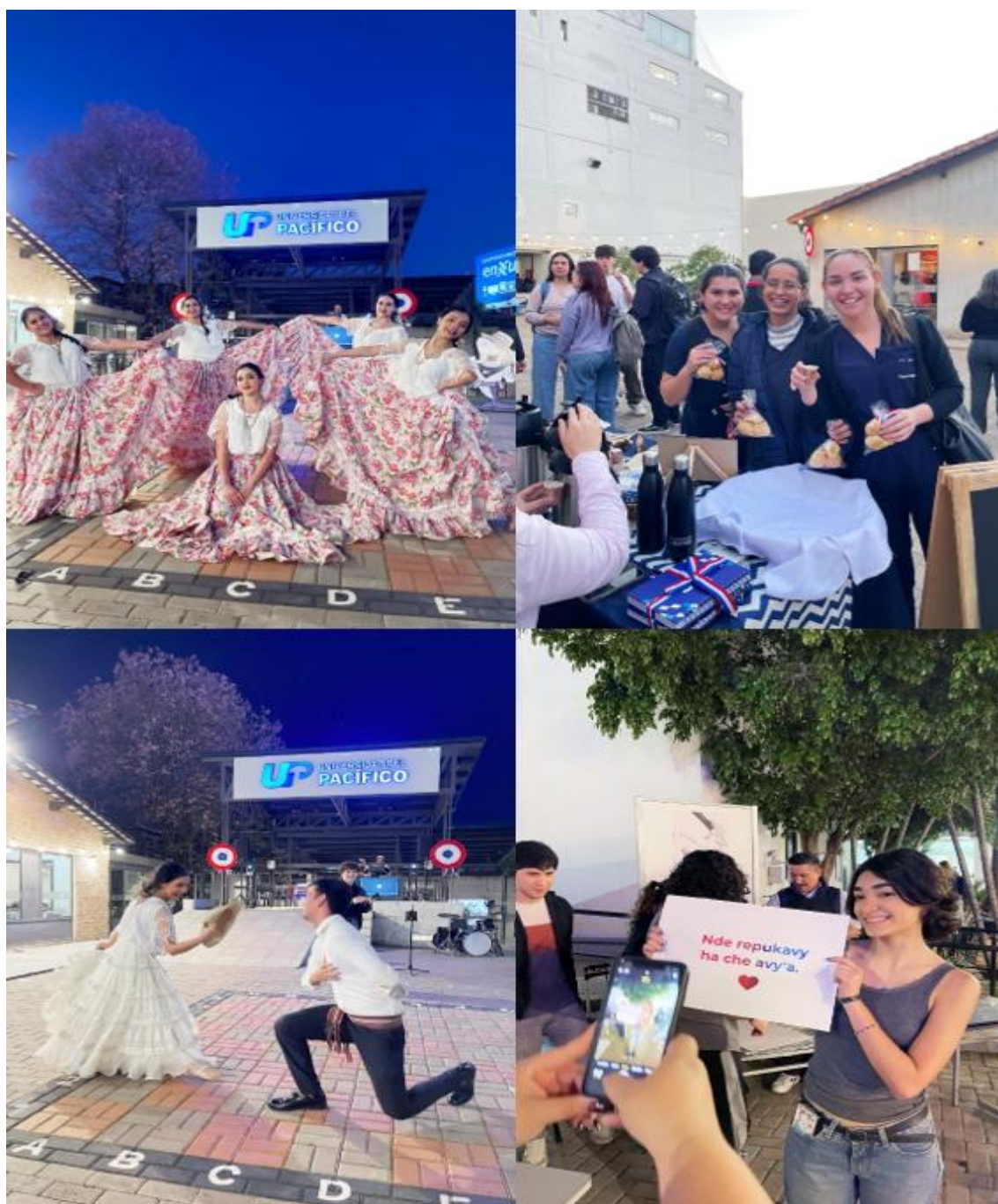
Imagen 20. Estudiantes participando en actividades culturales durante Agosto Folklórico 2025