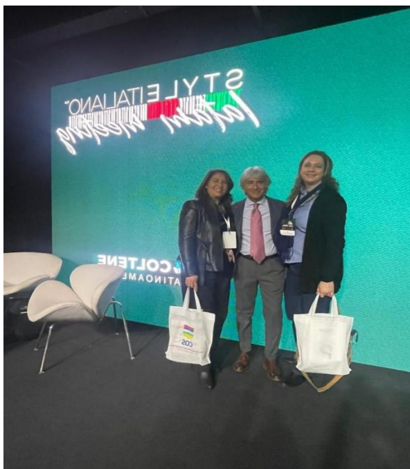
Imagen 6. Docentes de Odontología de la UP en capacitación internacional en Argentina

Los docentes de la Facultad de Odontología de la Universidad del Pacífico participaron en el congreso internacional Style Italiano – Latam Meeting, fortaleciendo la internacionalización de la carrera y la actualización en técnicas de estética dental (ver imagen 6).