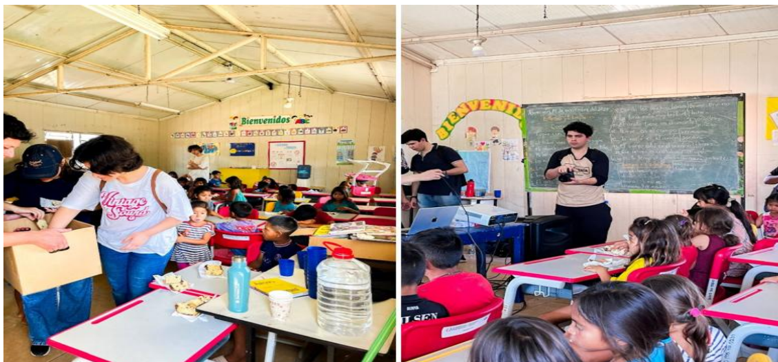
Imagen 14. Estudiantes de Comunicación Audiovisual desarrollan actividades RSU en la comunidad Cerro Poty