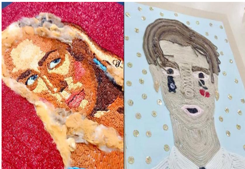
Imagen 17. Estudiantes de Diseño experimentan materiales y técnicas en talleres creativos