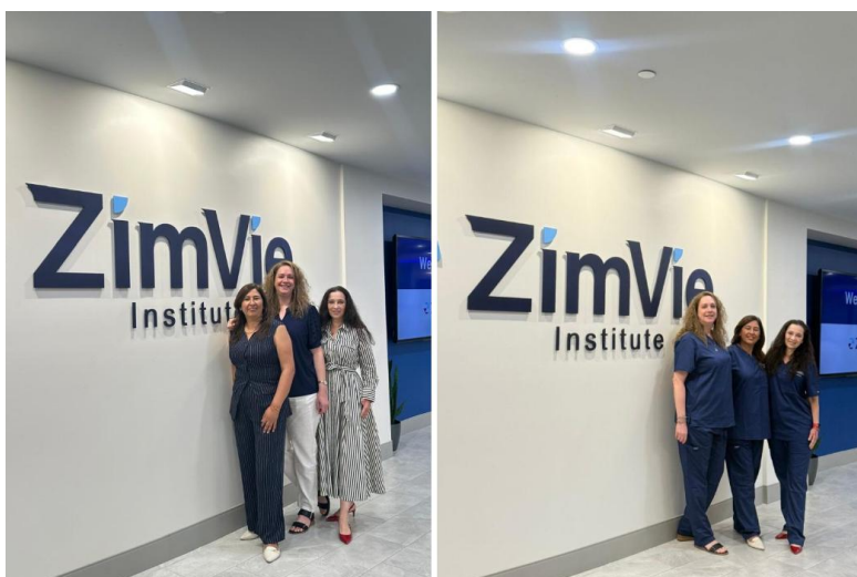
Imagen 7. Capacitación avanzada en implantes dentales en Florida

Los docentes de la Facultad de Odontología de la Universidad del Pacífico participaron en un curso internacional de implantes dentales, fortaleciendo la actualización profesional y la formación de los estudiantes (ver imagen 7).