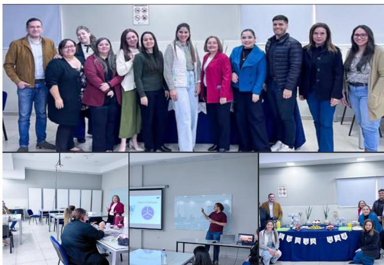
Imagen 13. Encuentro académico sobre metodologías activas e innovación educativa en la UP