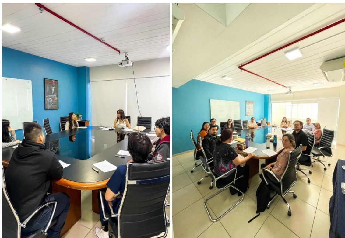
Imagen 1. Revisión del currículo de Medicina con participación internacional