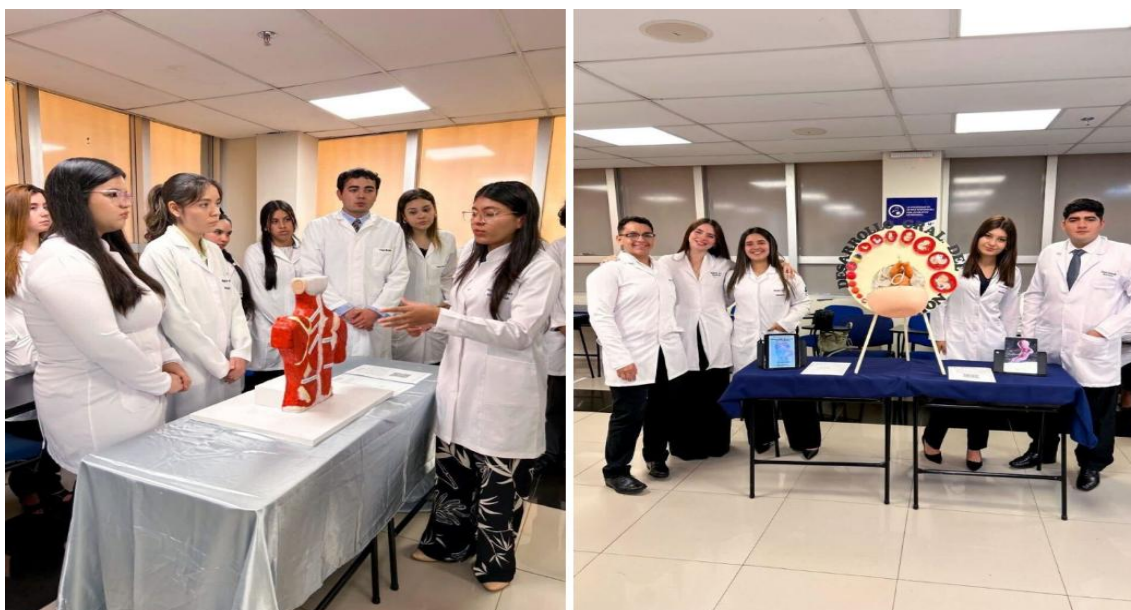
Imagen 5. Aprendizaje práctico y creatividad en estudiantes de Medicina

Los estudiantes de la Facultad de Medicina de la Universidad del Pacífico participaron en el Concurso de Maquetas, promoviendo el aprendizaje activo y la creatividad en la formación médica (ver imagen 5).