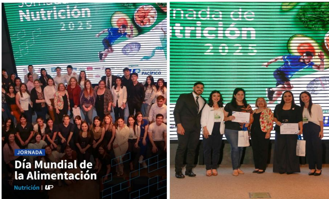
Imagen 12. Estudiantes participan en jornada científica de Nutrición