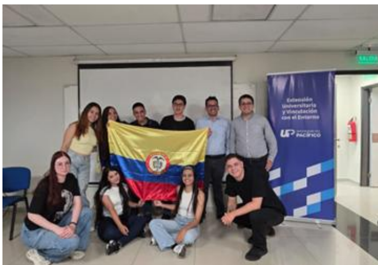
Imagen 4. Participación de estudiantes en el curso de estrategias sostenibles