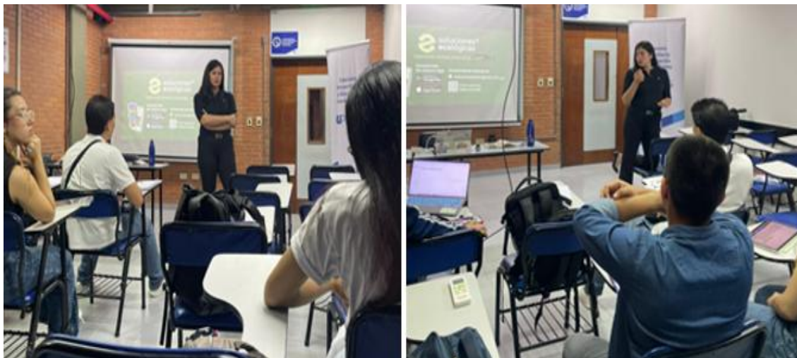
Imagen 10. Capacitación en soluciones ecológicas sobre economía circular y empleos verdes

comunidades y recicladores de base, promoviendo reducción de emisiones, ahorro de recursos y oportunidades laborales sostenibles. Asimismo, la empresa compartió su experiencia en Paraguay, mostrando estrategias basadas en economía circular, inclusión social y gestión responsable de residuos, cuyo objetivo es disminuir impactos ambientales y generar oportunidades laborales vinculadas a la sostenibilidad (ver imagen 10).