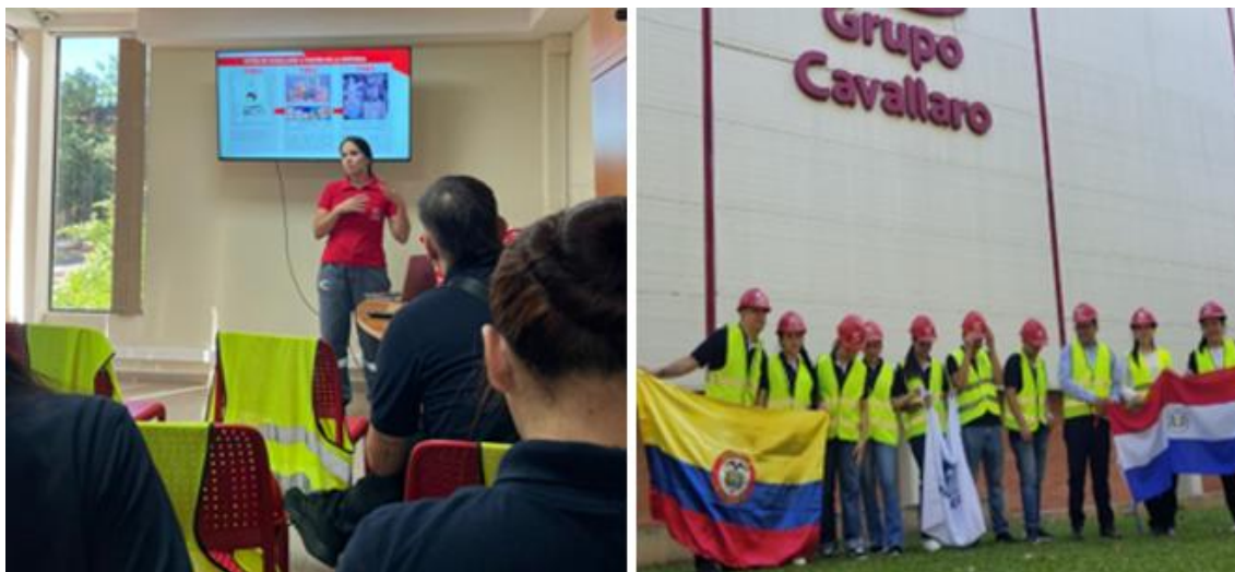
Imagen 8. Visita al Grupo Cavallaro

Se realizó una visita al Grupo Cavallaro, con el objetivo de conocer las buenas prácticas sostenibles de la empresa y su papel como referente nacional en exportación de productos paraguayos. La jornada incluyó una charla introductoria y recorrido por todas las instalaciones (ver imagen 8).