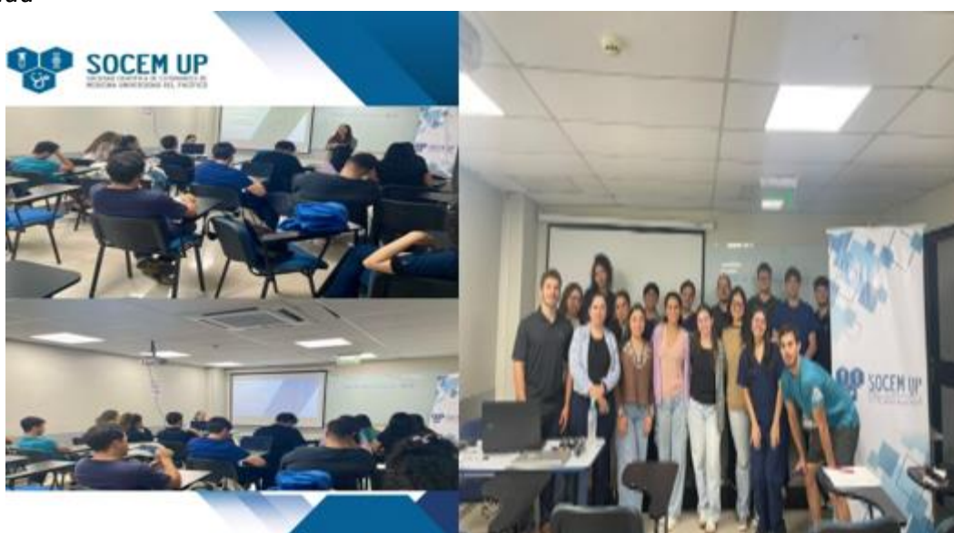
Imagen 1. Capacitación en Normas Vancouver para estudiantes de ciencias de la salud