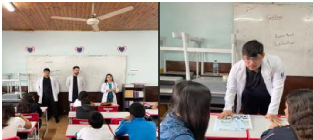
Imagen 6. Momentos de la salida de campo de estudiantes en Cerro Poty