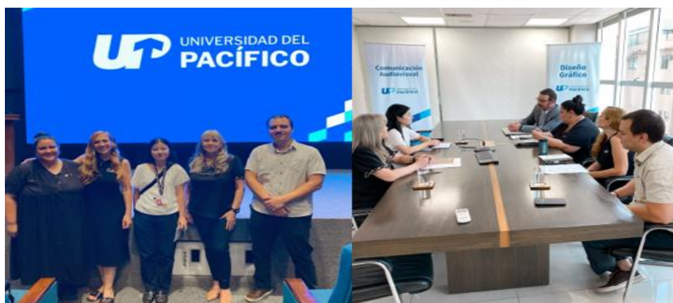
Imagen 24. Autoridades de la UP con representantes de la Embajada del Japón