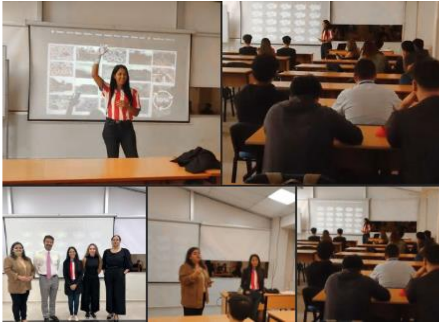
Imagen 19. Participantes reflexionan sobre sostenibilidad y experiencia del cliente en la Master Class UP