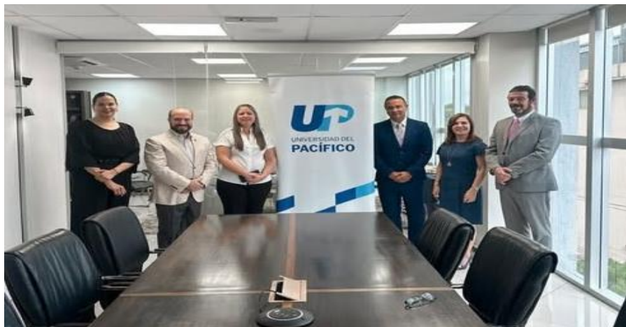
Imagen 22. Encuentro entre autoridades de INCAE y Universidad del Pacífico