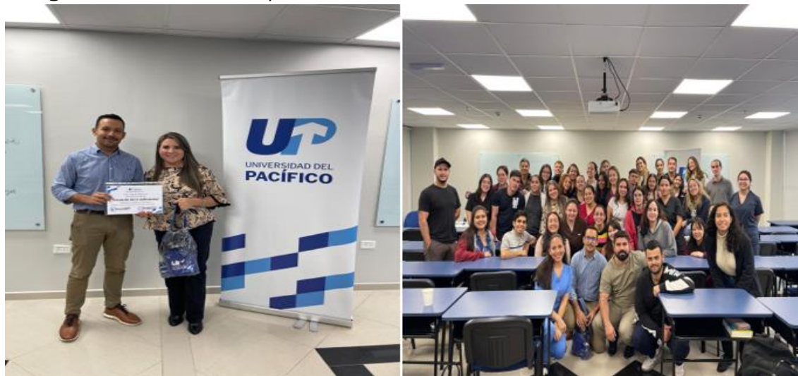
Imagen 5. Charla sobre la prevención del cáncer de cuello uterino