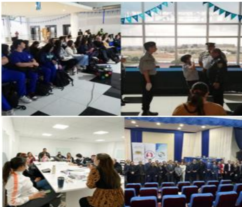
Imagen 11. Jornada de Cirugía y Seguridad Pública en el marco del XVIII Congreso Regional