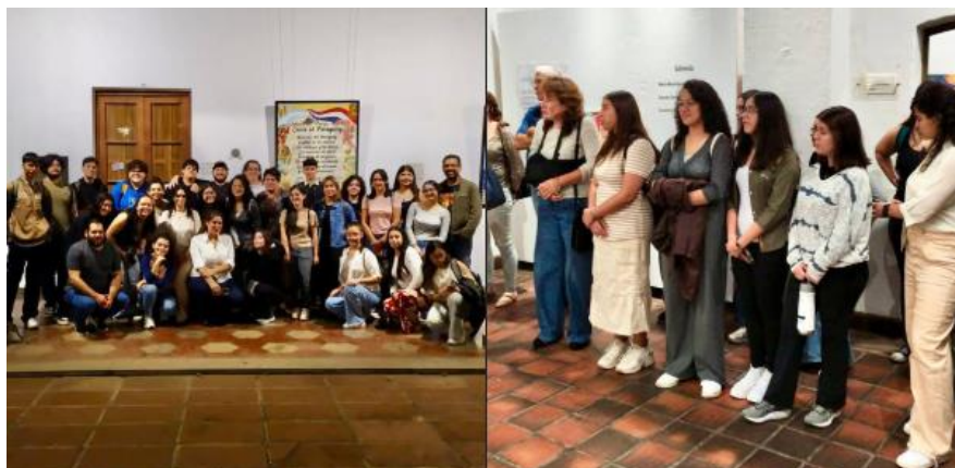
Imagen 15. Estudiantes de Diseño UP con maestros en salida de campo y exposición artística