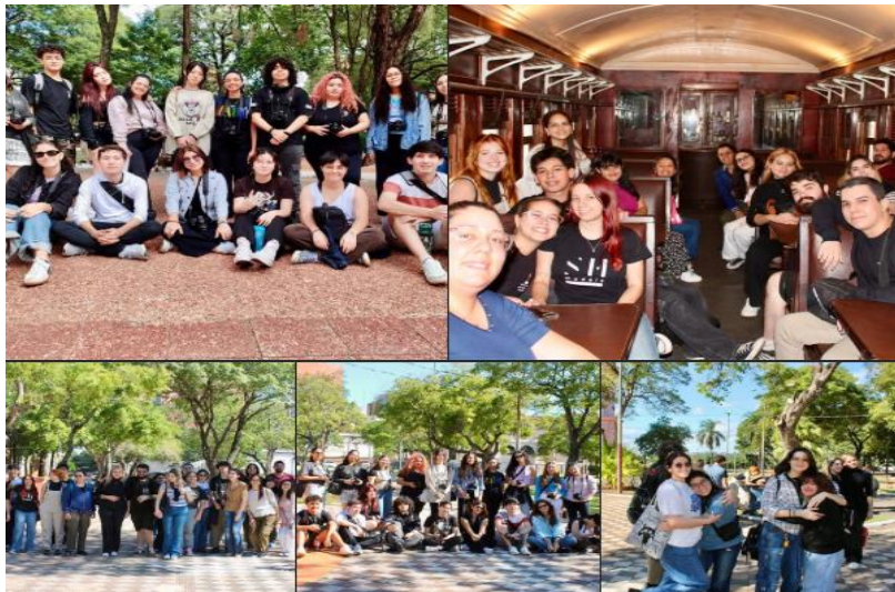
Imagen 14. Estudiantes y docentes de Diseño UP en recorrido histórico