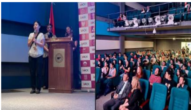
Imagen 17. Momentos destacados del evento de animé en la Universidad del Pacífico