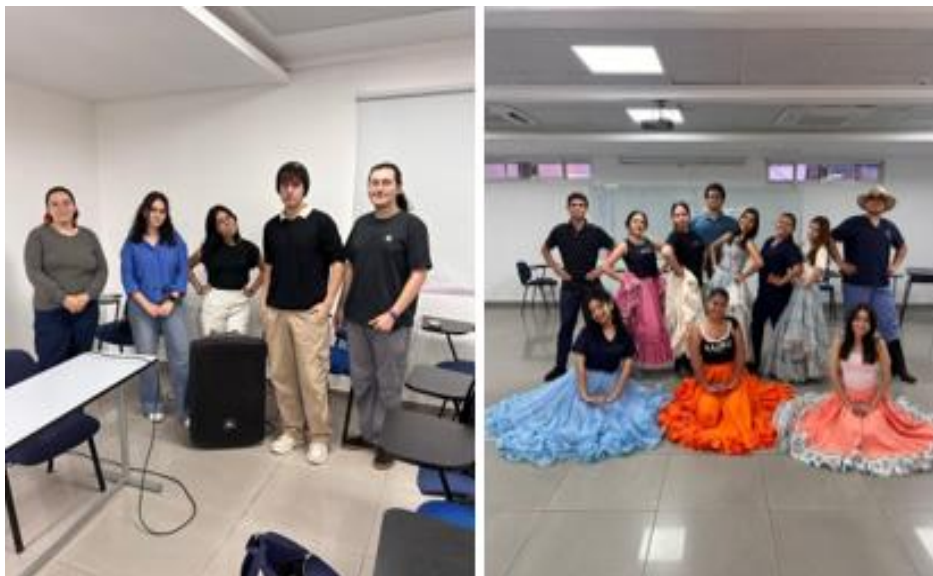
Imagen 27. Elenco artístico de la Universidad del Pacífico del proyecto Angiru