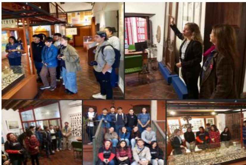
Imagen 16. Estudiantes de Diseño en recorrido reflexivo por la Manzana de la Rivera