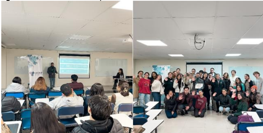
Imagen 4. Charla sobre estrés y ansiedad en medicina