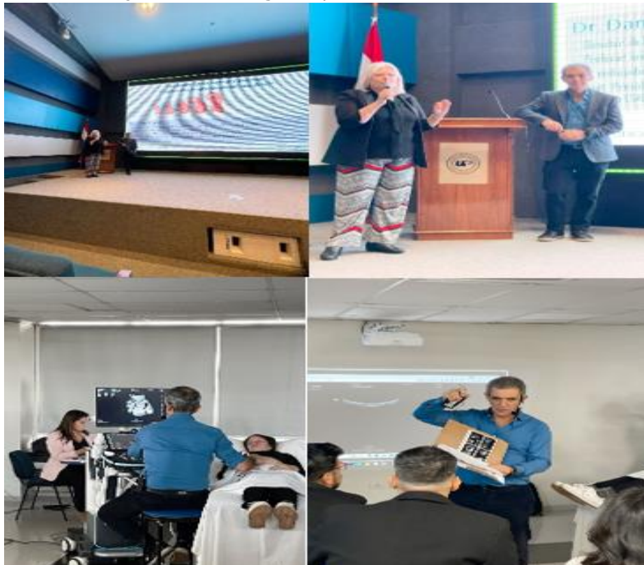
Imagen 3. Primera jornada de ecografía perinatal