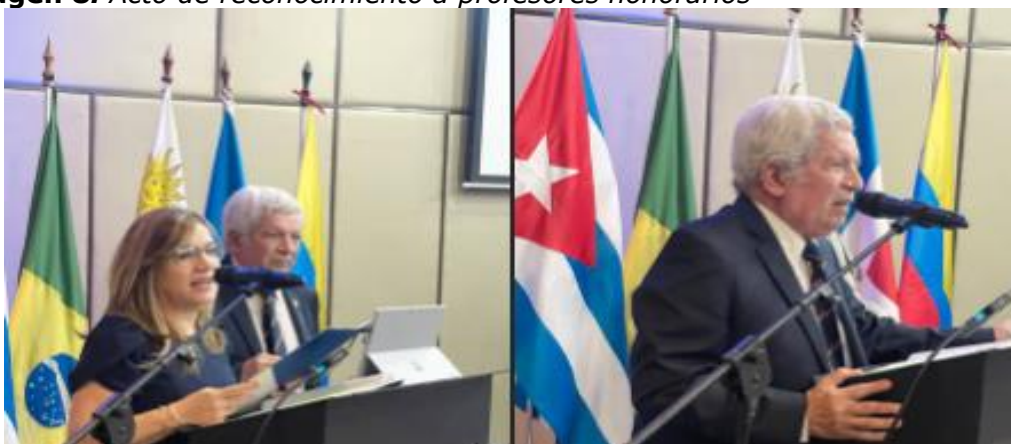
Imagen 8. Acto de reconocimiento a profesores honorarios