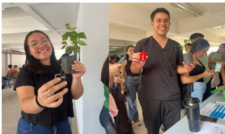
Imagen 26. Cambia humo por vida, con intercambio de vapeadores por plantines