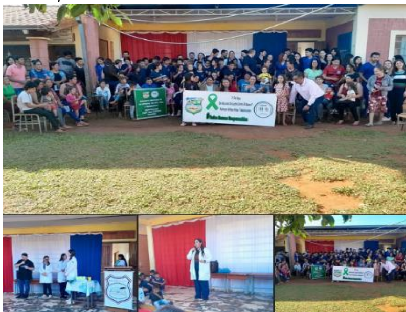
Imagen 12. Charla preventiva en la comunidad Villa Guillermina