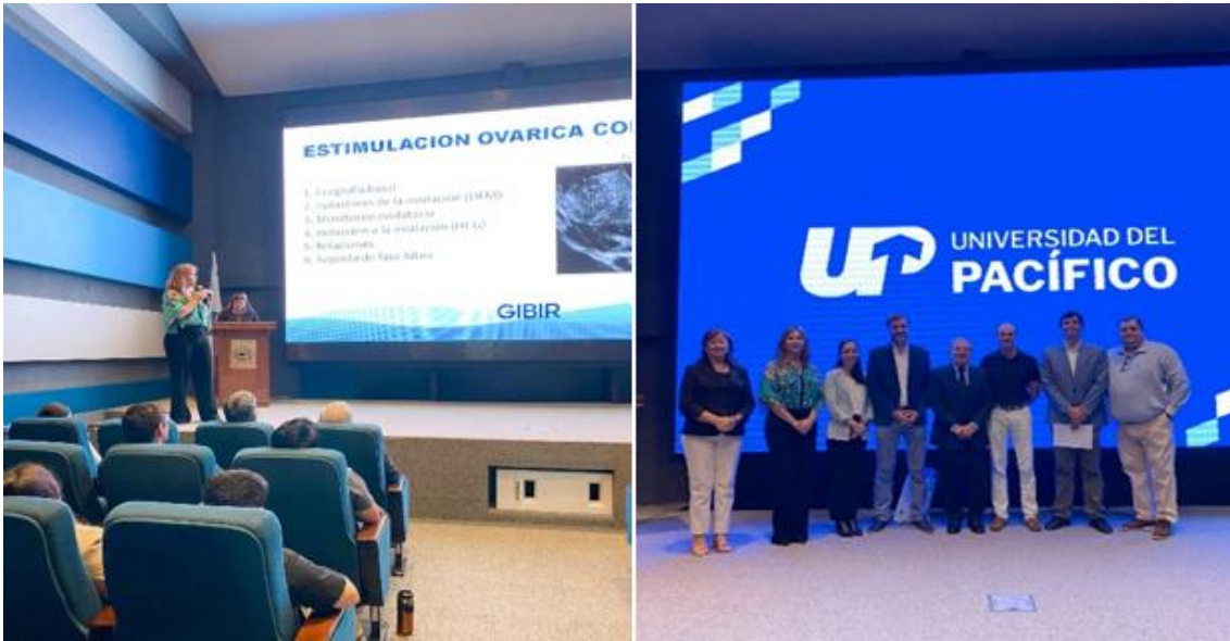
Imagen 2. Jornada de actualización en medicina reproductiva