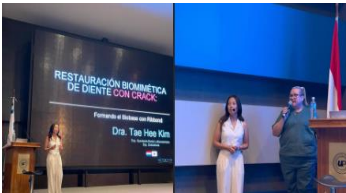
Imagen 10. Conferencia "Restauración Biomimética de Dientes con Crack"