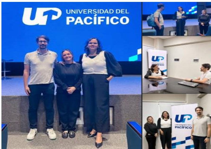
Imagen 20. Encuentro entre Finnegans S.A. y representantes de la Universidad del Pacífico