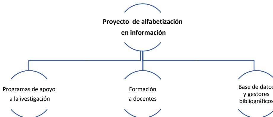
Figura 1. Programas de Alfabetización en información

Proyecto de Alfabetización en Información (ALFIN) , dictado a docentes y estudiantes que tiene como objetivo potenciar: a. La búsqueda, selección y difusión de la información en bibliotecas virtuales y bases de datos, el uso de las normas bibliográficas APA y VANCOUVER; b. La utilidad de los gestores bibliográficos, esto debido a que el CRAI “contribuye exponencialmente al desarrollo y fomento de la alfabetización informacional (ALFIN) y las políticas de formación para toda la vida” (Guerrero Concepción y García Rodríguez, 2012) y; c. El apoyo a la gestión de la investigación en la institución por medio de asesoramientos personalizados y en grupos a través del proyecto ALFIN, junto con el equipo editorial, ayudan en la revisión de las referencias bibliográficas y la revisión de similitud de texto de estos mediante el Software anti-plagio además del soporte para la gestión del software Open Journal Systems y miembro del Comité Editorial de la Revista Científica de Ciencias de la Salud, Ciencias Sociales y la Multidisciplinar en la UP. Ver Figura 1.